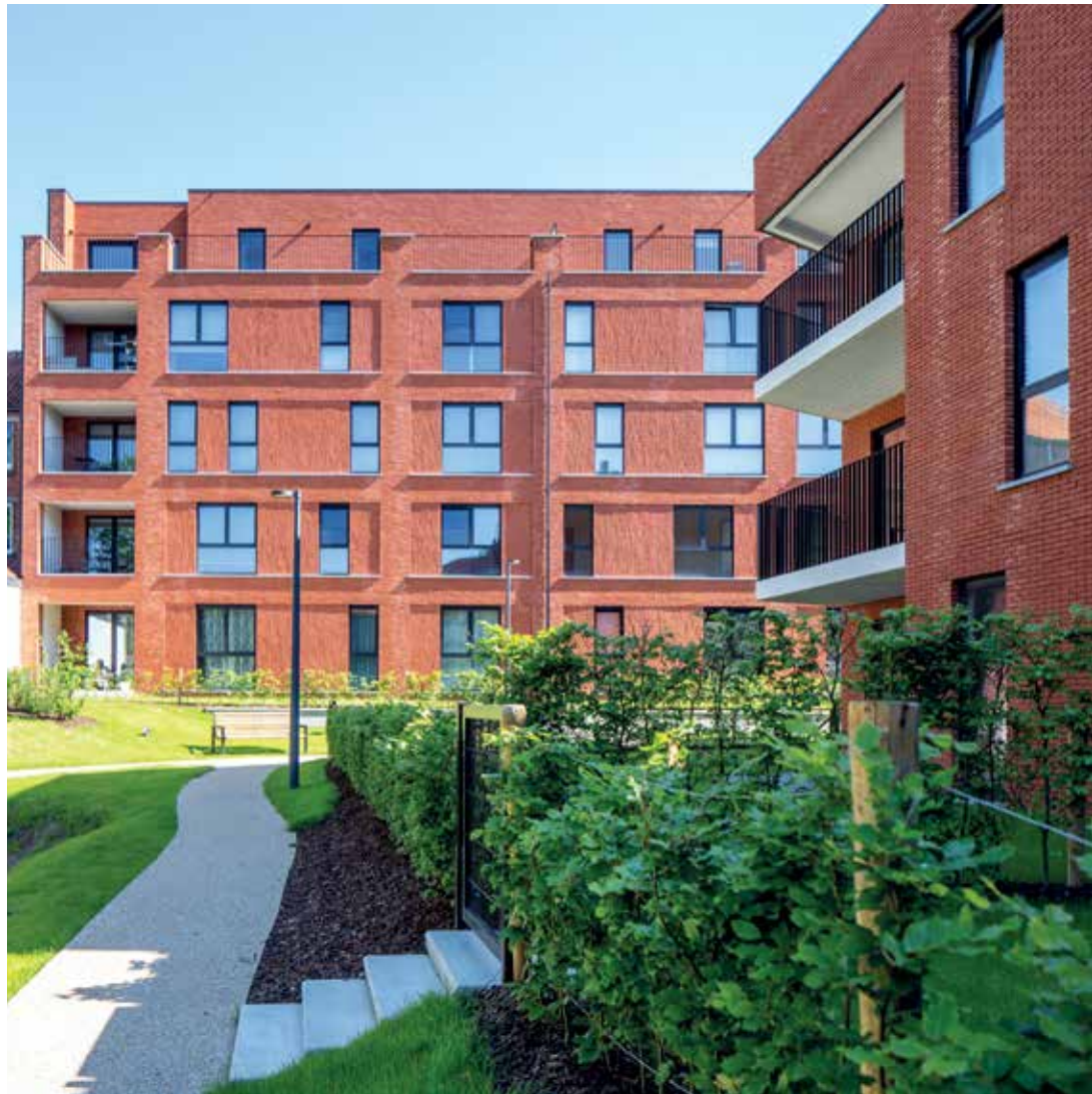
Groen is alomtegenwoordig op de site van De Blekerij.