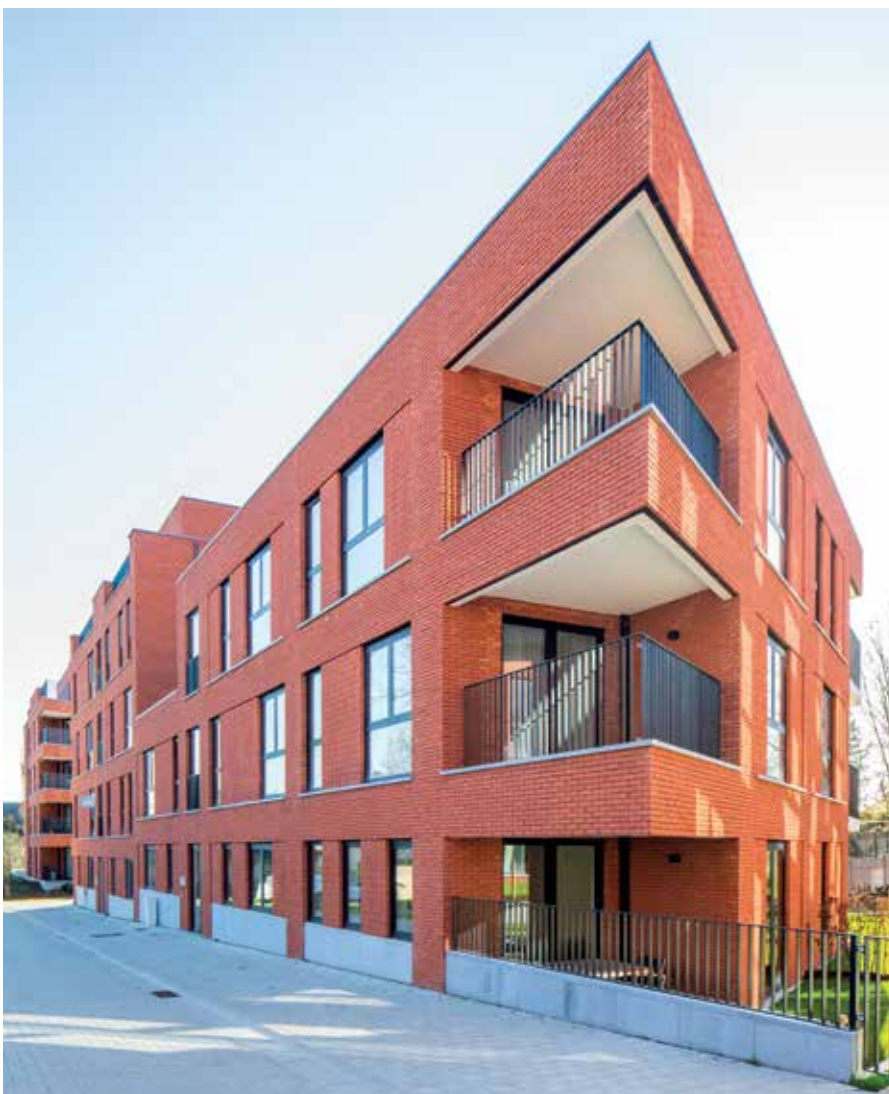
Met zijn rode baksteengevels brengt De Blekerij opnieuw kleur in het straatbeeld.

Met zijn rode baksteengevels brengt De Blekerij opnieuw kleur in het straatbeeld. "De stad wilde een aantrekkelijke 'Demerarchitectuur' die een echt 'verhaal' vertelt. Daar hebben we op ingespeeld