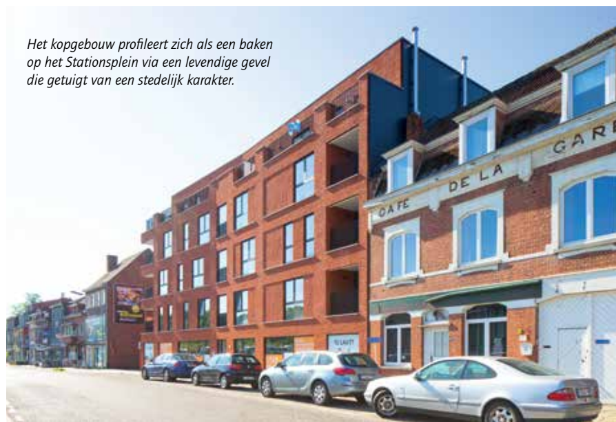
Het kopgebouw profileert zich als een baken op het Stationsplein via een levendige gevel die getuigt van een stedelijk karakter.

“De Blekerij staat voor een compacte combinatie van verschillende woonvormen”